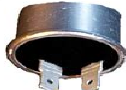
NAPA #552 Flasher $1.17

Just attach #552 flasher to the cut O/G and LBI wires from your stock flasher.